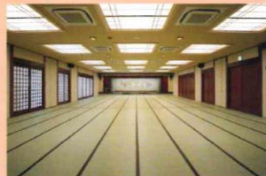
大広間 - 大和の間