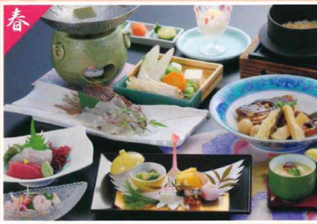
鯛しゃぶ会席 6,600円(税込)～