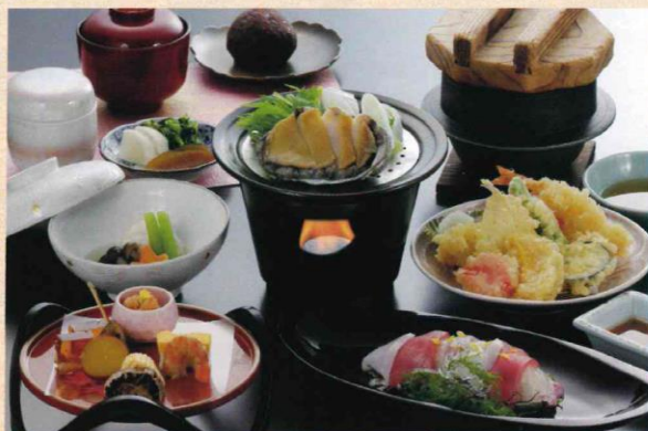
あわび会席 6,600円(税込)