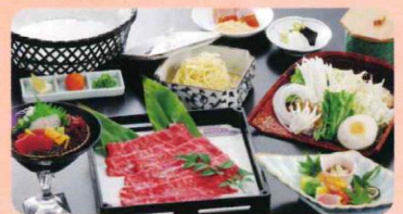
しゃぶしゃぶ膳 5,500円～(税込)