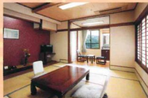
本館 - 和室