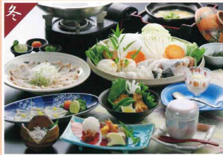
てっちりコース 8,800円(税込)～