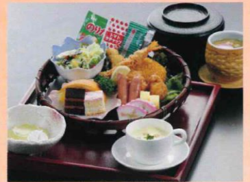
お子様ランチ 2,200円(税込)