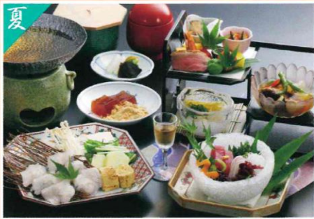
はもちり会席 6,600円(税込)～