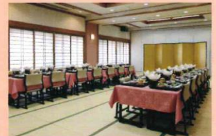
大広間 - 金剛の間