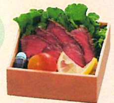
(E)ローストビーフ 2,700円