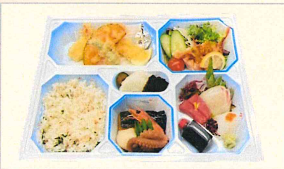
特選幕ノ内弁当 3,240円