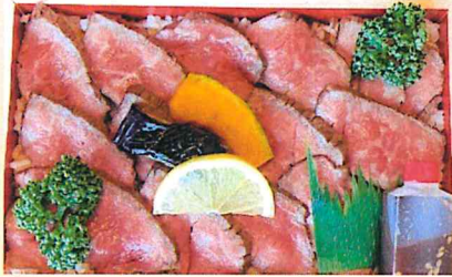
ローストビーフ重 1,300円