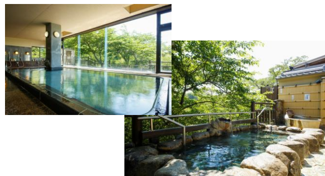
天然湧出 信貴山温泉

「王寺駅」からホテルまでは 無料シャトルバスで約10分です 15:00 又は 16:00の便をご予約ください